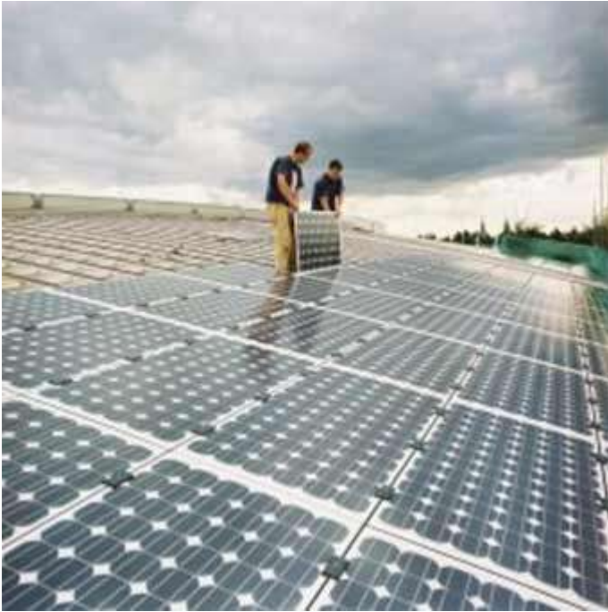
Fig.4:Sistema fotovoltaico da 500 kWp allo Zoo “Blijdorp” di Rotterdam

Le domande per ottenere il diritto alle tariffe incentivanti potranno essere inoltrate al GRTN esclusivamente nei periodi dal 1° al 31 marzo (più di 1900 domande presentate nella sola giornata del 1 marzo 2006!), dal 1° al 30 giugno, dal 1° al 30 settembre e dal 1° al 31 dicembre di ciascun anno (le domande inoltrate al GRTN al di fuori di questi periodi non saranno prese in considerazione e dovranno essere ripresentate) con una delle seguenti modalità: a mezzo di plico raccomandato con avviso di ricevimento, tramite consegna a mano, oppure tramite corriere con registrazione della data di ricevimento da parte del GRTN. In base quindi al nuovo DM 06/02/06 le domande di ammissione agli incentivi, ed anche le eventuali integrazioni a domande incomplete presentate in precedenza, inoltrate al GRTN nel periodo 16 febbraio-28 febbraio 2006 non saranno tenute in considerazione; esse potranno essere nuovamente inoltrate al GRTN a partire dal 1° marzo 2006. La domanda di ammissione, presente nell'allegato A della Delibera 40/06 (che ha modificato e integrato la precedente delibera 188/05), insieme alla documentazione prevista, deve essere chiusa in un plico riportante l'intestazione “GRTN – Incentivazione impianti fotovoltaici ai sensi dei DM 28 luglio 2005 e 6 febbraio 2006”, e deve essere inoltrata al Gestore della rete di trasmissione nazionale Spa, nella sede di Viale Maresciallo Pilsudski 92, 00197 Roma. Ogni plico dovrà contenere una sola domanda.