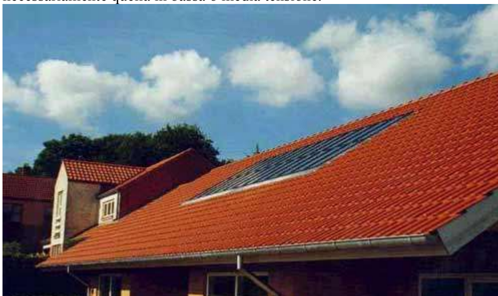
Fig.3:Pannelli fotovoltaici integrati nel tetto di una abitazione in Danimarca