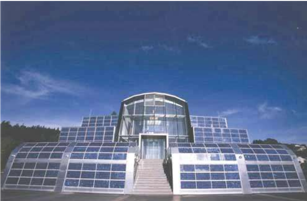
Fig.5:Sistema fotovoltaico da 22 kWp in un Istituto austriaco

Il GRTN, entro sessanta giorni dalla scadenza prevista per l'inoltro delle domande, rende noto il valore della potenza nominale cumulativa "rimasta" a disposizione per le domande successive.